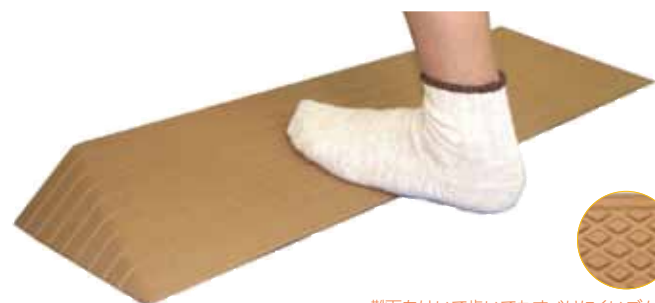
靴下をはいて歩いてもすべりにくいゴム製

ゴム製滑り止め段差解消スロープ。靴下を履いて歩いても上り下りも安心安全です。すべてのサイズが14度の勾配に設計されています。